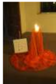
„Du bist einmalig“